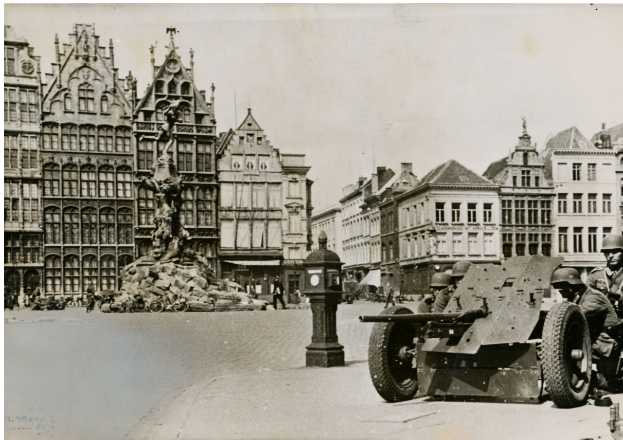
Tank op de Grote Markt