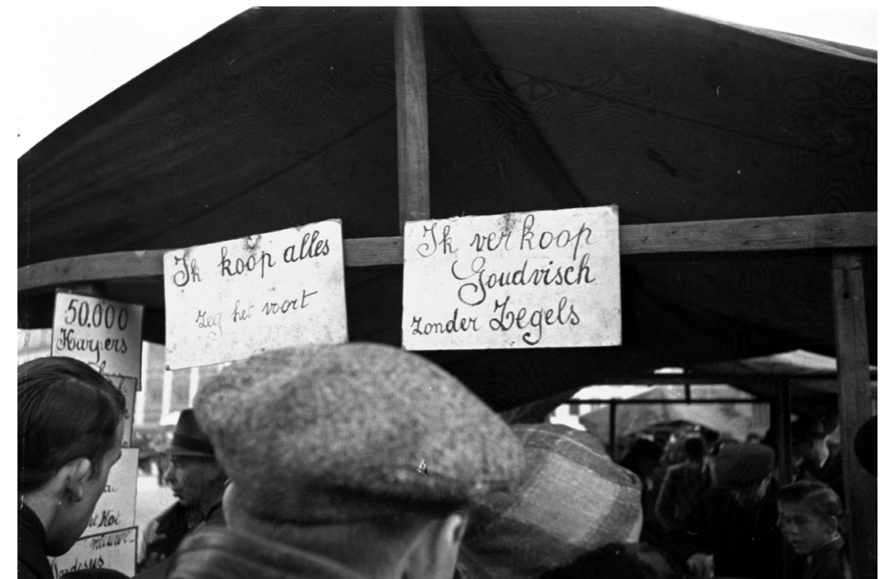
Markt Antwerpen