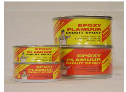
Epoxy plamuur set 400gr en 1000gr