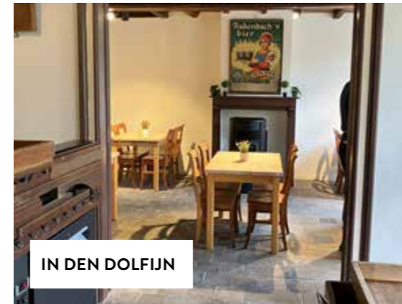
IN DEN DOLFIJN