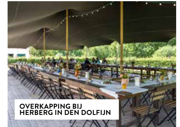
OVERKAPPING BIJ HERBERG IN DEN DOLFIJN