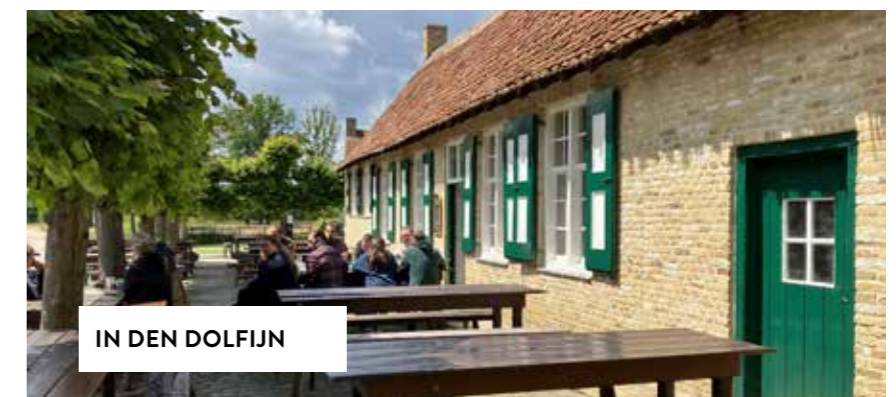
IN DEN DOLFIJN