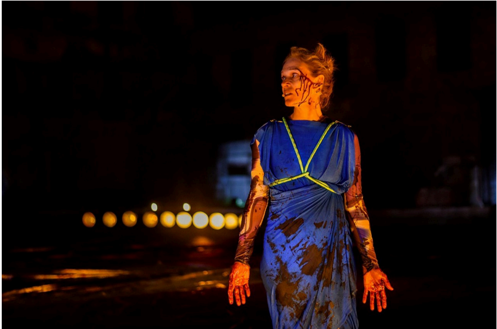
Klytaimnestra: haar man overleeft zijn thuiskomst niet.

Bloeddorstige oorlogen, heftige intriges en kibbelende goden: iedereen kent de ingrediënten van de Griekse tragedie. Mastodonten als Shakespeare of Tsjechov haalden er hun mosterd, maar waarom blijven de Trojanen, de Thebanen en de Argonauten theatermakers in Vlaanderen vandaag nog boeien?