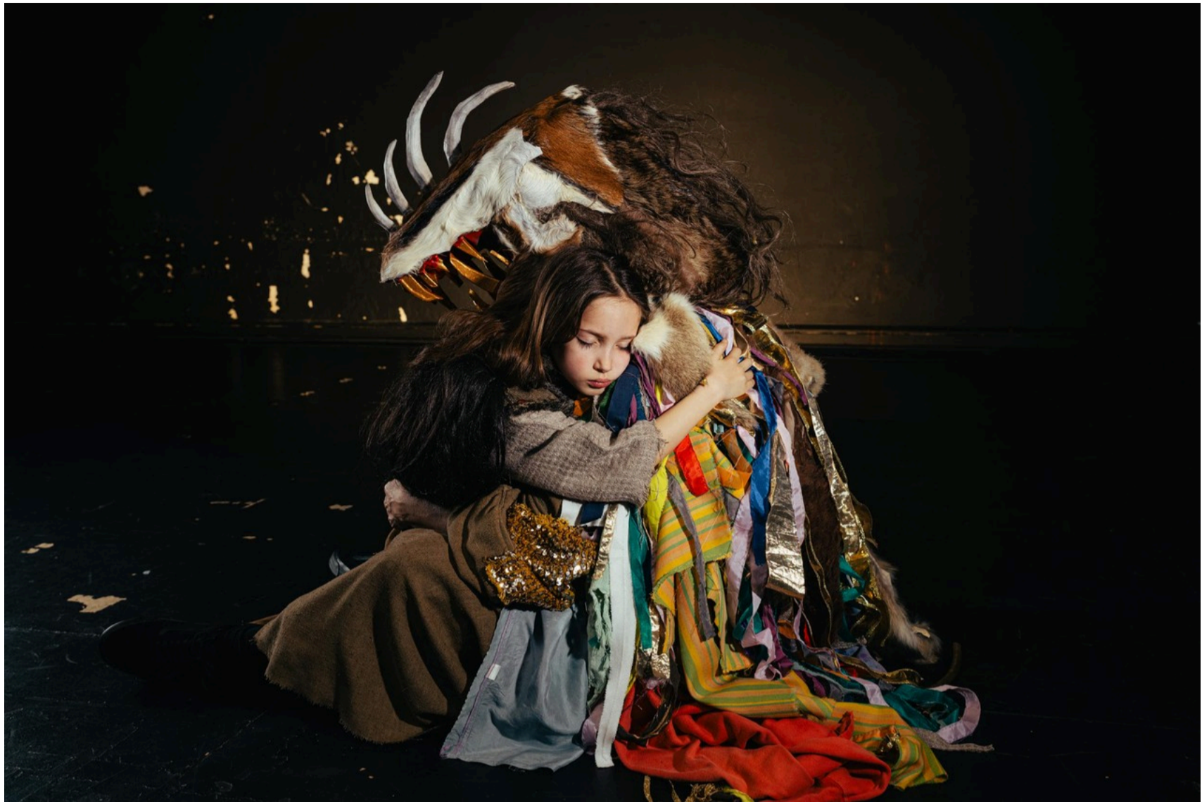
Medea's kinderen: in Griekse stukken worden ethische vraagstukken op de spits gedreven.

anderen al meer dan 70 jaar gewelddadig onderdrukken. Het is de grootste uitdaging van alle kunstwerken die ik met mijn ploeg ooit heb aangepakt. Voor mij is het geen ‘Bambi op het ijs’, maar Bambi in een mijnenveld.”