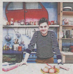
'Dagelijkse kost': 100.000 kijkers minder.

gramma rondt de jongste tijd vaker de kaap van de 200.000 kijkers, maar een voltreffer is het nog lang niet. Piet Huysentruyt haalt met Smakelijk! in de vooravond op Vier met moeite 40.000 kijkers. De VRT laat weten geen 'al te zware conclusies te verbinden' aan de dalende cijfers van Dagelijkse kost . Toch lijkt het erop dat de Vlaamse televisiekijker langzaam genoeg begint te krijgen van broodpudding, knolseldersoep en andere kwarktaart. (red)