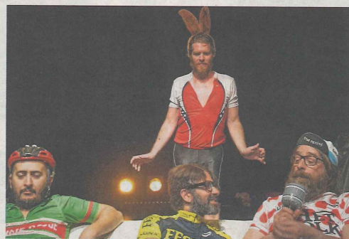
'Flandrien' van Action Zoo Humain: een eerbetoon.

'Alles wat we zoeken in het leven, zit in de koers. Geluk en verdriet, dromen en struikelen, heroïek, maar ook persoonlijke drama's'